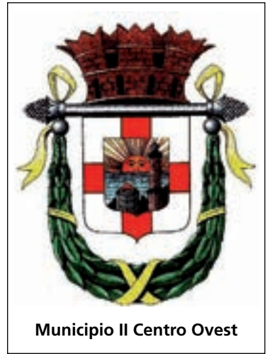
Municipio II Centro Ovest

Spedizione in abbonamento postale - 45% Legge 662/96 Art. 2 comma 20/b - Poste Italiane Filiale di Genova